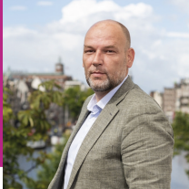
Rutger Groot Wassink Wethouder Gemeente Amsterdam