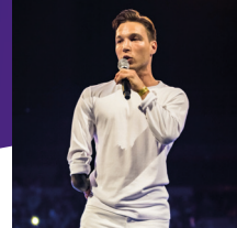
I AM REDO Motivational Speaker